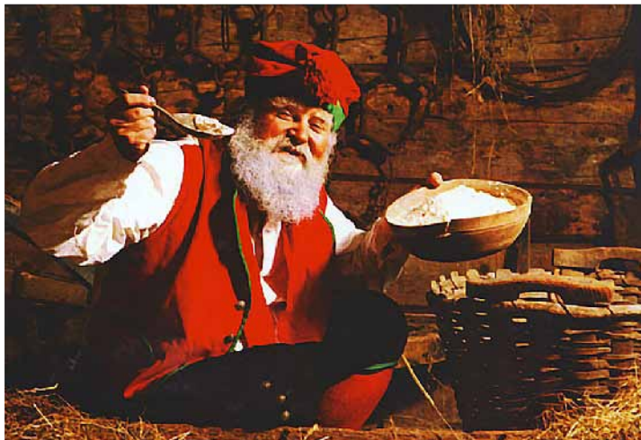
www.real-santa.no